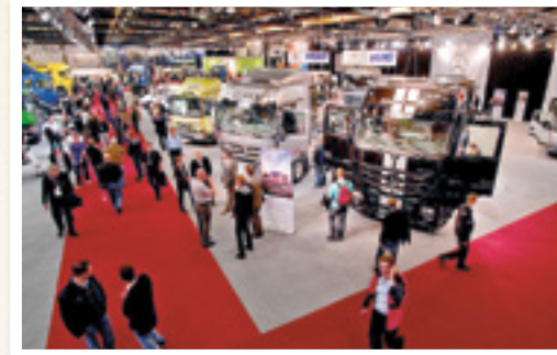
Kuljetus 2011 -näyttely Jyväskylässä