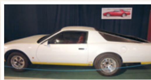
Avolavapakettiautoksi muutettu Pontiac Firebird

korotusratkaisuihin ja suksiboksilla kiinteästi varusteltuihin autoihin. Pakettiautoja muutettiin farmariautoiksi vielä 2000-luvulla paloittelemalla takaistuimia ja rakentamalla väliseiniä farmarikorisiin henkilöautoihin.